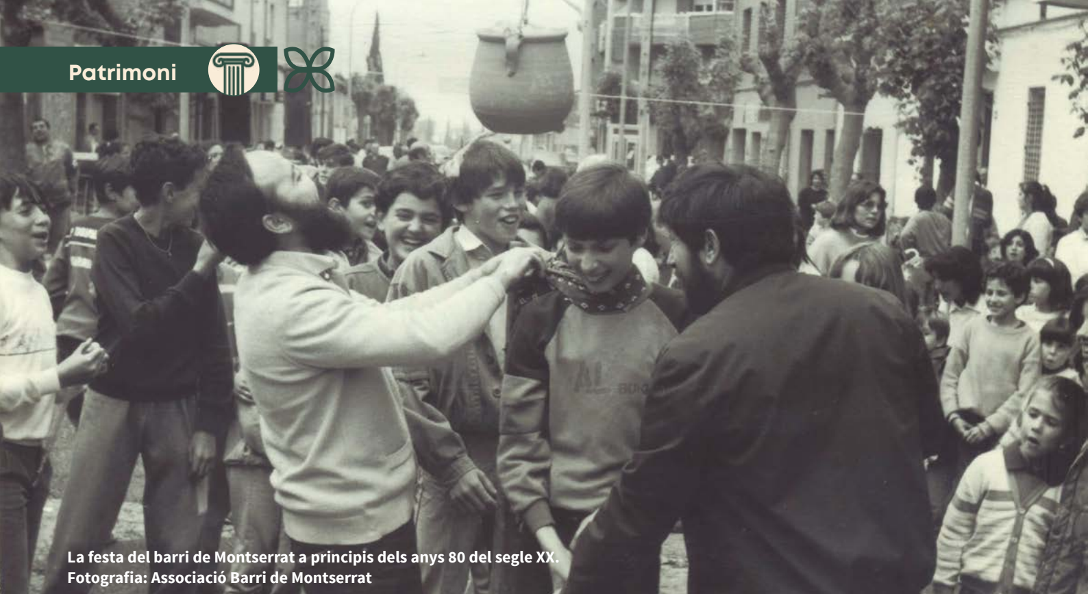
La festa del barri de Montserrat a principis dels anys 80 del segle XX.