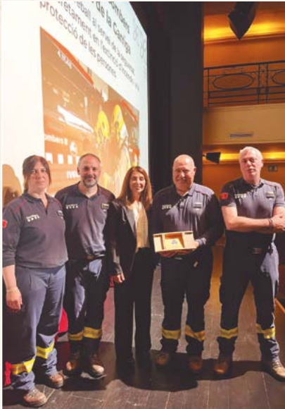
Bombers voluntaris de la Garriga