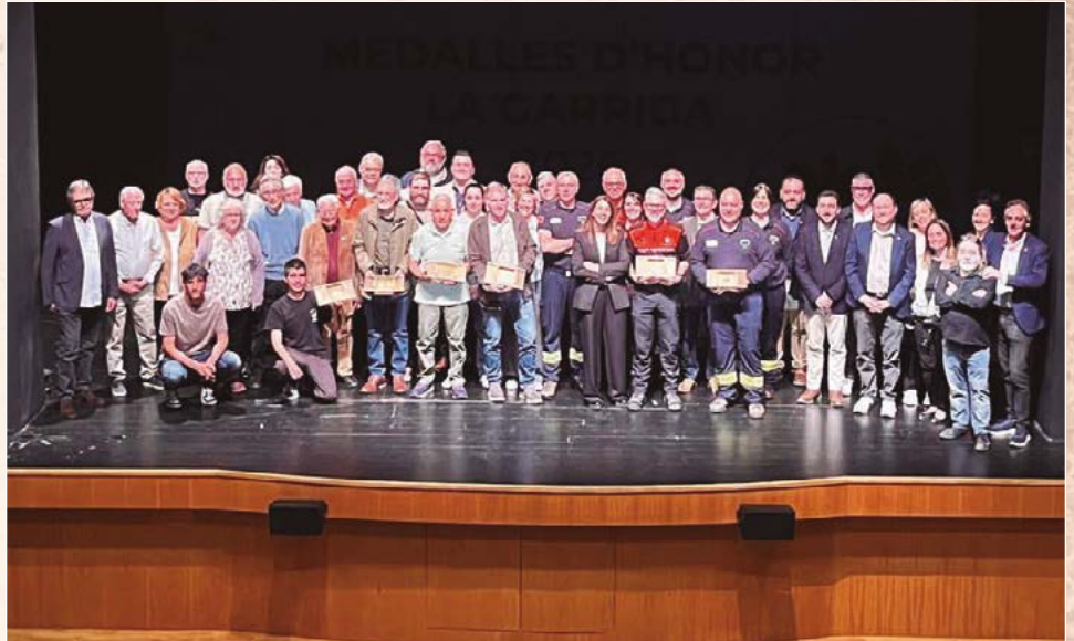
Foto de totes les persones distingides