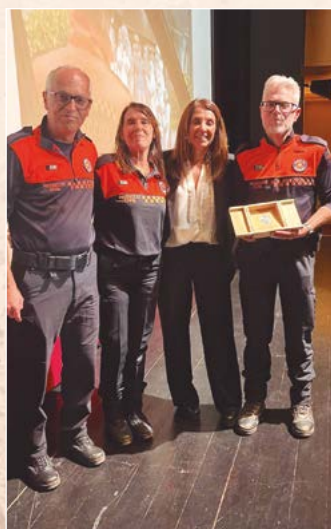
Protecció Civil La Garriga