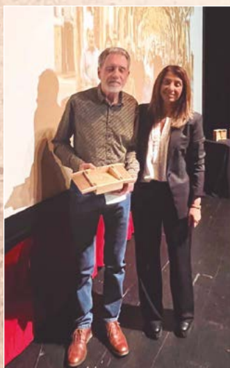
Associació La Garriga Secreta