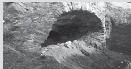
El forn de Can Terrers, més gran

Arran d'una campanya per datar l'estructura situada al parc d'aventures, el personal tècnic va descobrir que les dimensions eren superiors a les esperades i que podria ser gairebé industrial. Això atorga, segons el personal expert, "encara més interès a l'element, perquè és una estructura monumental amb la qual es podrien explicar moltes coses". De moment, es creu que data del segle XVIII, època de màxim esplendor de la masia de Can Terrers que amb diferents masoveries també tenia un molí. Per tot plegat, s'ha iniciat un procés d'estudi exhaustiu i diverses actuacions per preservar-lo.