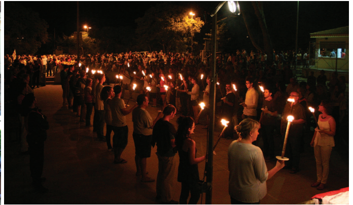
L'Ajuntament va celebrar un acte institucional a la plaça del Silenci. Representants de l'ANC van desfilat amb torxes durant l'Homenatge a la Senyera

La commemoració de l'Onze de setembre va comptar amb activitats diverses, que van començar dilluns 10 de setembre a la nit amb l'Aplec de la Sardana de la Garriga i amb el tradicional Homenatge a la Senyera. Aquest any l'acte, organitzat per Òmnium Cultural, va comptar amb la col·laboració de l'Assemblea Nacional Catalana (ANC), que va protagonitzar una desfilarada de torxes. A l'acte, que es va fer a