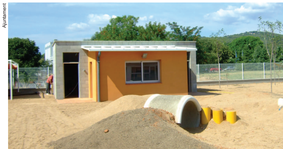
Gràcies a aquesta actuació l'alumnat gaudeix d'uns nous lavabos al pati

L'escola bressol municipal Les Caliués ha ampliat els seus equips aquest estiu amb la construcció d'un petit edifici auxiliar, que s'ha situat a l'extrem oest de la parcel·la que ocupa el centre.