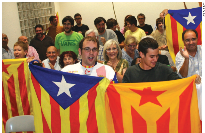
La votació, a la Sala de Plens, on l'aprovació de la moció es va viure amb emoció i crits a favor de la independència per part del públic

El Ple del passat dimecres 26 de setembre va declarar la Garriga “territori català lliure”. La declaració va arribar després d’una moció per la independència de Catalunya, presentada per Solidaritat Catalana per la Independència (SI) i Acord Independentista per la Garriga. A banda d’aquests dos grups, també hi van votar a favor Convergència i Unió (CiU) i Iniciativa per Catalunya Verds (ICV). El Partit dels Socialistes (PSC) i el Partit Popular (PP) hi van votar en contra.