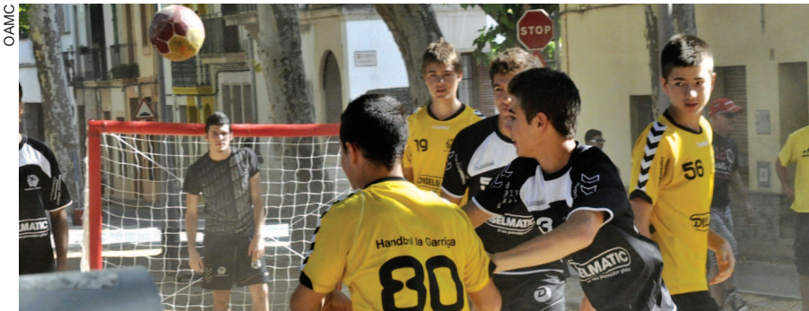
Al poble es practiquen una trentena de disciplines esportives

L'Ajuntament organitzarà la primera fira d'entitats esportives el proper diumenge 21 d'octubre a les dues plaques del centre del poble.