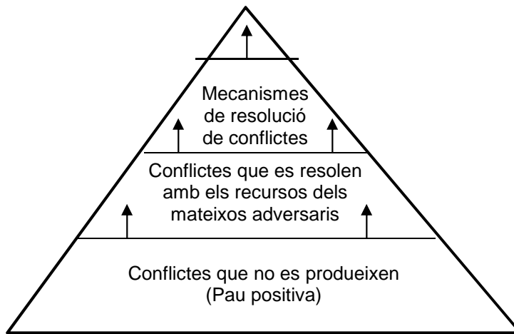
Piràmide dels conflictes

• El primer pis és el dels conflictes que no s'arriben a produir , per les condicions de vida i l'organització d'aquella societat. Una societat equilibrada que permeti una vida digna a tothom, on es respectin els drets humans, amb una participació política suficient, és a dir, una societat amb un mínim de violència estructural i amb el màxim de pau positiva, serà de ben segur una societat molt menys conflictiva que una societat desestructurada, descohesionada i injusta. Com més eixemplem aquest pis millor. Són conflictes que no tindrem. El que acabem de llegir en l'apartat 5 referent a la pau positiva va justament en aquest sentit.