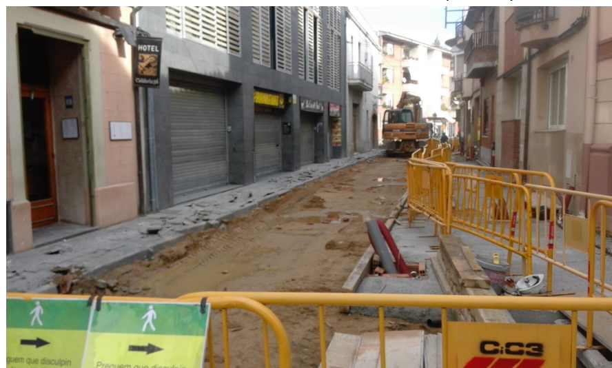
Vistes de l'estat actual del carrer Sant Ramón (FASE III)