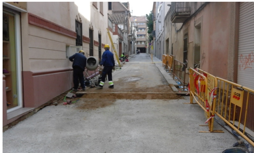
Vista dels treballs de pavimentar vorera parell (FASE III)