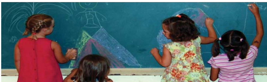
La població total del municipi, segons el padró de juliol, és de 15.665 habitants.

Només un 28,5% de les persones que viuen a la Garriga hi han nascut, segons les dades de l'última dinàmica de població del municipi. L'estudi, elaborat per la Diputació de Barcelona i encarregat des de l'Ajuntament, presenta dades representatives de la realitat social del municipi. Així, per exemple, posa de manifest que a la Garriga hi viuen un total de 15.665 persones i que un 7,8% de la població total és d'origen estranger.