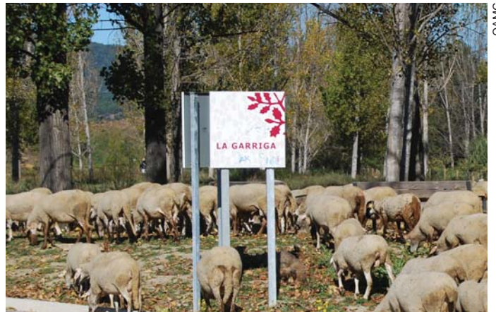
S'han entrevistat persones de la Garriga relacionades amb el món de la pagesia. El projecte preveu millorar l'oferta de turisme cultural

L'Ajuntament ha iniciat un projecte transversal per tal de potenciar, estudiar i donar a conèixer el passat i present rural del municipi. El projecte, anomenat "La Garriga rural: a l'ombra del modernisme?", vol millorar el coneixement i les investigacions històriques sobre la Garriga com a poble rural, i posar en valor alguns dels espais històrics relacionats amb la història agrícola del municipi.