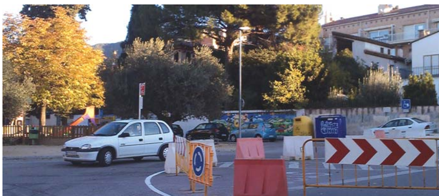
La creació de la rotonda forma part del projecte per millorar la circulació

L'Ajuntament ja ha fet entrega del projecte d'elaboració de la rotonda de la plaça del Silenci a la Diputació, que s'espera que en les properes setmanes doni el seu vistiplau. L'ens supramunicipal és el propietari d'aquest tram de vial, que forma part de la carretera de Samalús.