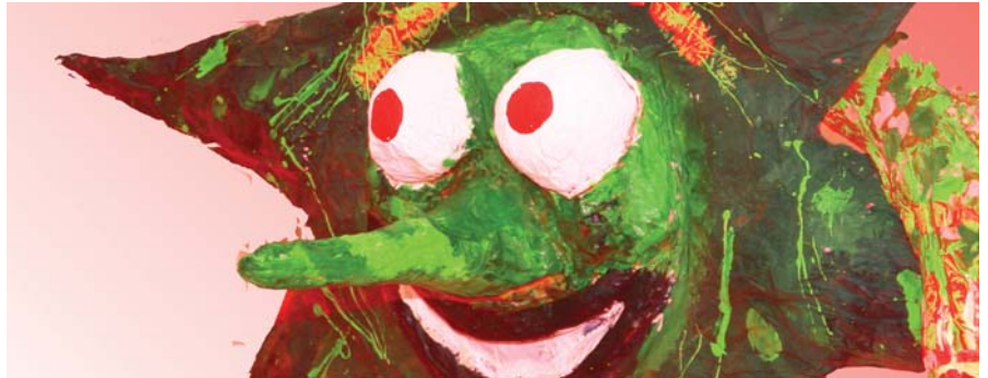
Un cop fet la desfilada, la Garriga acomiadarà el Rei Carnestoltes en una processó

La festa del Carnestoltes arriba a la Garriga el proper dissabte 9 de febrer, amb la tradicional rua pels carrers del poble i el lliurament de premis a les millors disfresses i comparses participants. La rua començarà a les 18 hores al Passeig, just al davant del Teatre. Des del Passeig, la desfilada seguirà pels carrers de Rosselló, Banyes, Samalús, Nostra Senyora de la Salut i la plaça de les Oliveres, on enfilà els carrers de Cardedeu, Sant Ramon i Calàbria