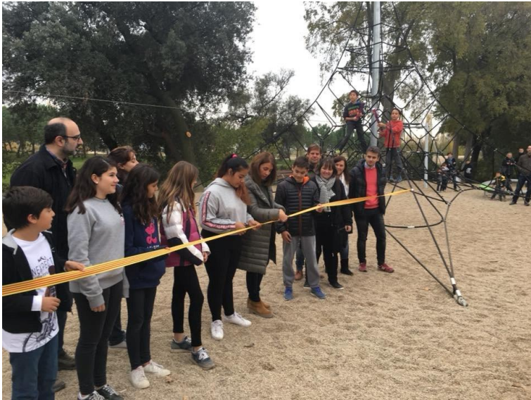
Inauguració del Parc d'Adventures de Can Terrers

Preparem dinàmiques per recollir propostes a les escoles