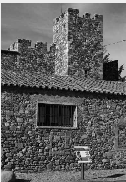
El Casal de Rosanes, declarat Bé Cultural d'Interès Nacional de la

Garriga, compta amb un nou plafó interpretatiu. La placa dóna informació històrica i patrimonial per tal que el/la visitant pugui copsar la importància de la casa de Rosanes per a la Garriga, per la configuració del paisatge del seu entorn i, fins i tot, per la història de Catalunya. La família Rosanes, en aquest sentit, va tenir un paper destacat en el si de la Corona d'Aragó. Amb aquesta senyalització també es reforça la posada en valor de l'itinerari de l'Antiguitat a l'edat mitjana , del qual forma part la casa.