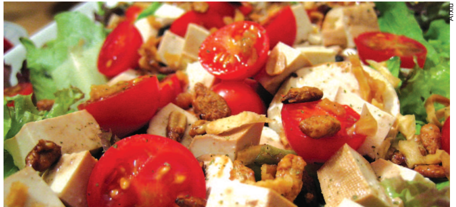
L'alimentació mediterrània es basa en productes frescos, locals i de temporada.

L'Agència de Salut Pública de Catalunya ha acreditat el restaurant Jovi com a establiment promotor de l'alimentació mediterrània (AMED). Aquesta acreditació garanteix alguns requisits, com la utilització d'oli d'oliva, un àmplia oferta de verdures i hortalisses o la prioritat de peixos i carns magres en la confecció dels plats. També assegura la inclusió de productes integrals, de fruita fresca i de làctica amb baix contingut de greix. Una altra de les característiques dels establiments AMED és que faciliten informació sobre opcions de lleure actiu (passeigs, circuits, etc.) al voltant del