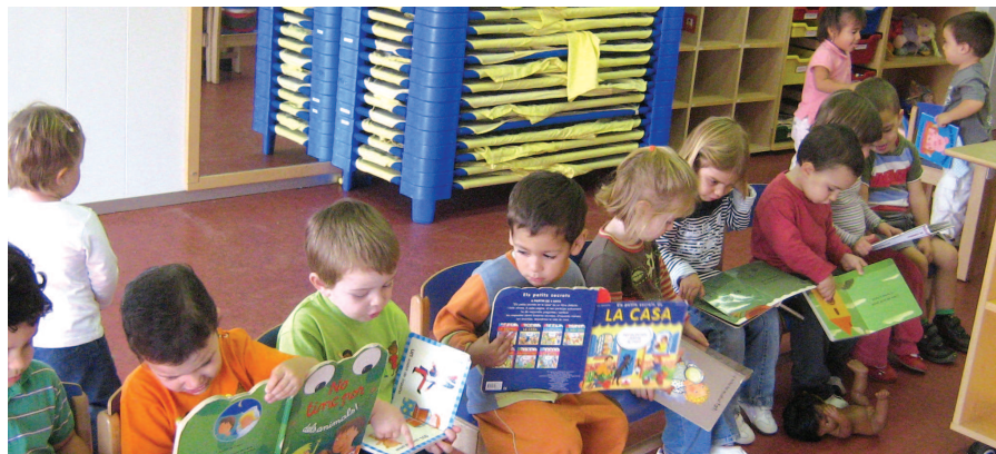
El govern de la Garriga vol que els ajustos en educació afectin el mínim possible les famílies

La Junta de Govern de la Garriga del passat 14 de maig va aprovar els preus públics de l'Escola Municipal de Música (EMM) i l'Escola Bressol Municipal (EBM) per al curs 2012-2013. Una de les prioritats del govern de la Garriga és que els ajustos en matèria d'educació tinguin la mínima afectació possible per a les famílies del municipi i, alhora, que es garanteixi la qualitat i la continuïtat dels serveis que