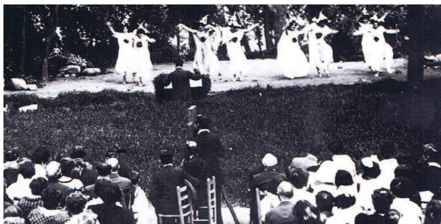
El teatre de la naturalesa reunia centenars de persones a la Garriga

L'Ajuntament organitzarà del 20 al 22 de juliol unes jornades modernistes al municipi.