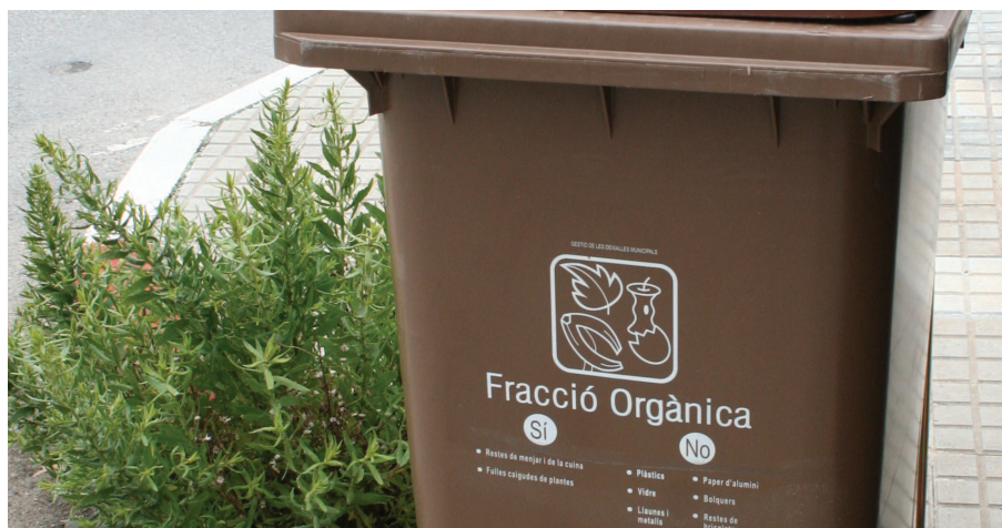
Les restes de jardí no s'han de dipositar als contenidors de matèria orgànica

Els establiments de restauració del municipi han rebut, durant la segona quinzena de maig, la visita d'agents informadores del Consorci per a la Gestió dels Residus del Vallès Oriental (CGRVO). A través d'aquestes visites, s'ha recordat a les persones responsables dels establiments la importància d'efectuar correctament la recollida selectiva dels residus que produeixen i s'ha comprovat si necessiten disposar de nous cubells d'escombraries.