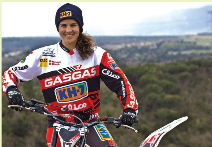
Laia Sanz s'entrena a la zona de la Garriga

Després de tots els títols que ha guanyat (11 mundials, 10 europeus, 5 trials de les Nacions, 2 Dakars, podem dir que Laia Sanz no té límits?