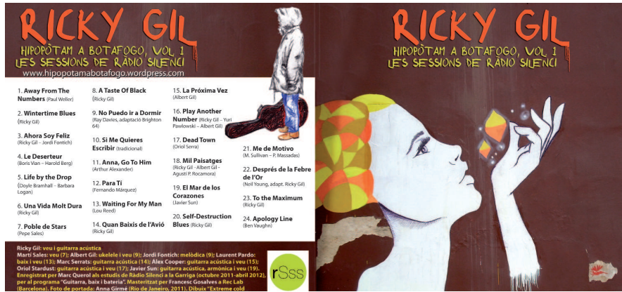
El CD presenta una selecció dels temes enregistrats al programa 'Guitarra, baix i bateria'