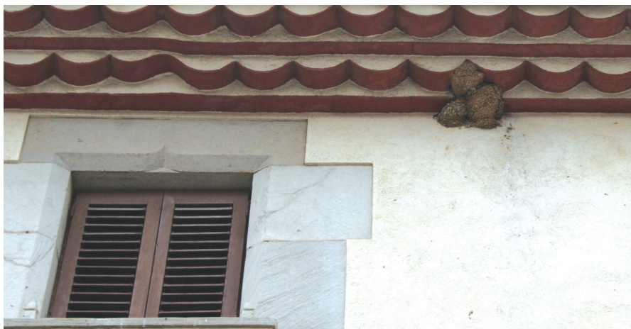
La iniciativa vol afavorir el coneixement i la conservació de les orenetes

Conèixer la població d'orenetes de la Garriga per afavorir-ne la conservació. Aquest és l'objectiu principal del Projecte Orenetes, una iniciativa de l'Institut Català d'Ornitologia al qual s'ha sumat l'Ajuntament. A través d'aquest programa s'elaborarà un cens d'orenetes d'aquest 2012.